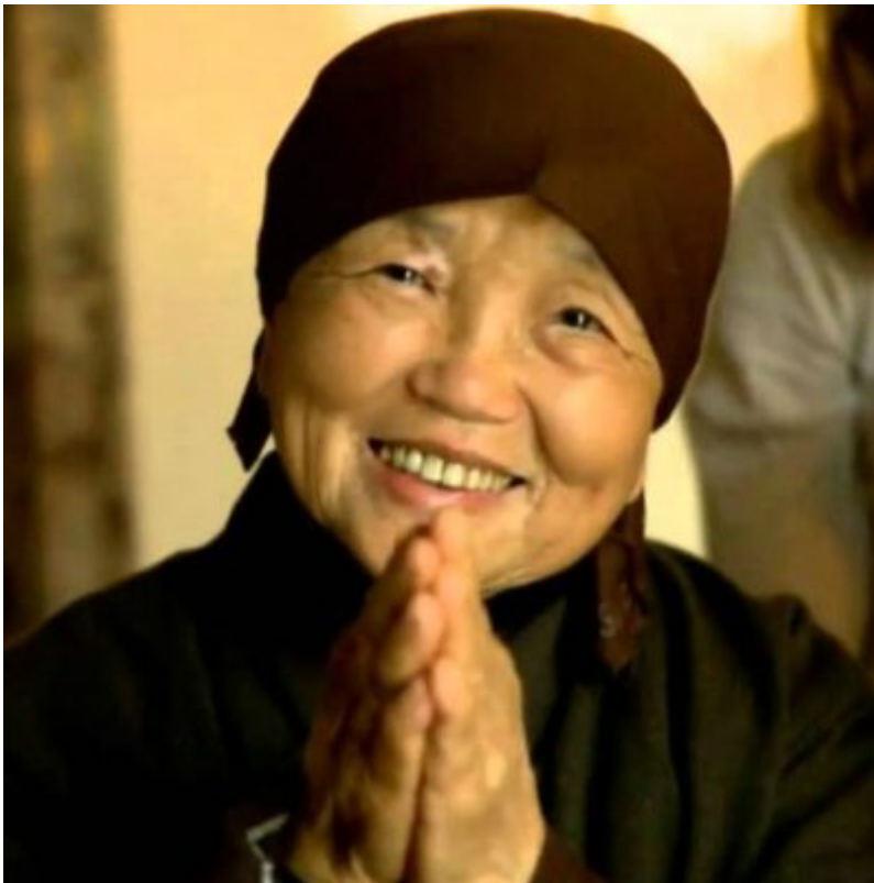
Sister True Emptiness (Chan Khong)

Gli insegnanti ci indicano il “sentiero” su cui camminare per trovare pace e amore in noi stessi: partecipare a un ritiro è essenziale per la nostra crescita spirituale, abbiamo bisogno di esempi di pratica viventi per poter proseguire il nostro cammino spirituale.